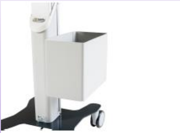
KORB FÜR HÄNGEHEFTER