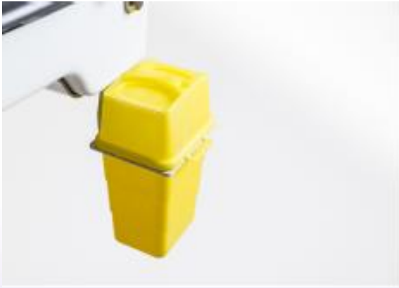
HALTER FÜR SICHERHEITSBEHÄLTER