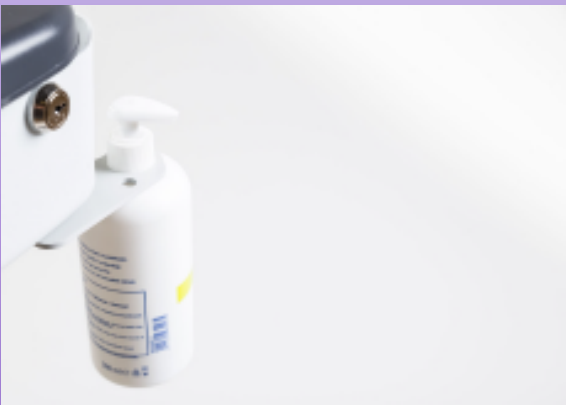
HALTER FÜR DESINFEKTION