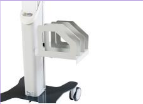
HALTER FÜR PATIENTENAKTE